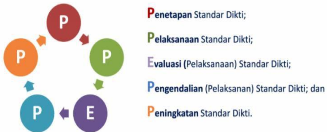
Gambar 1.1. Siklus SPMI

Buku Panduan Audit Mutu Internal ini merupakan buku panduan untuk semua auditor dalam melaksanakan audit mutu internal (AMI) di lingkungan Universitas Dr. Soetomo. PPEPP dilakukan secara siklus, yang diilustrasikan di dalam Gambar di bawah ini.